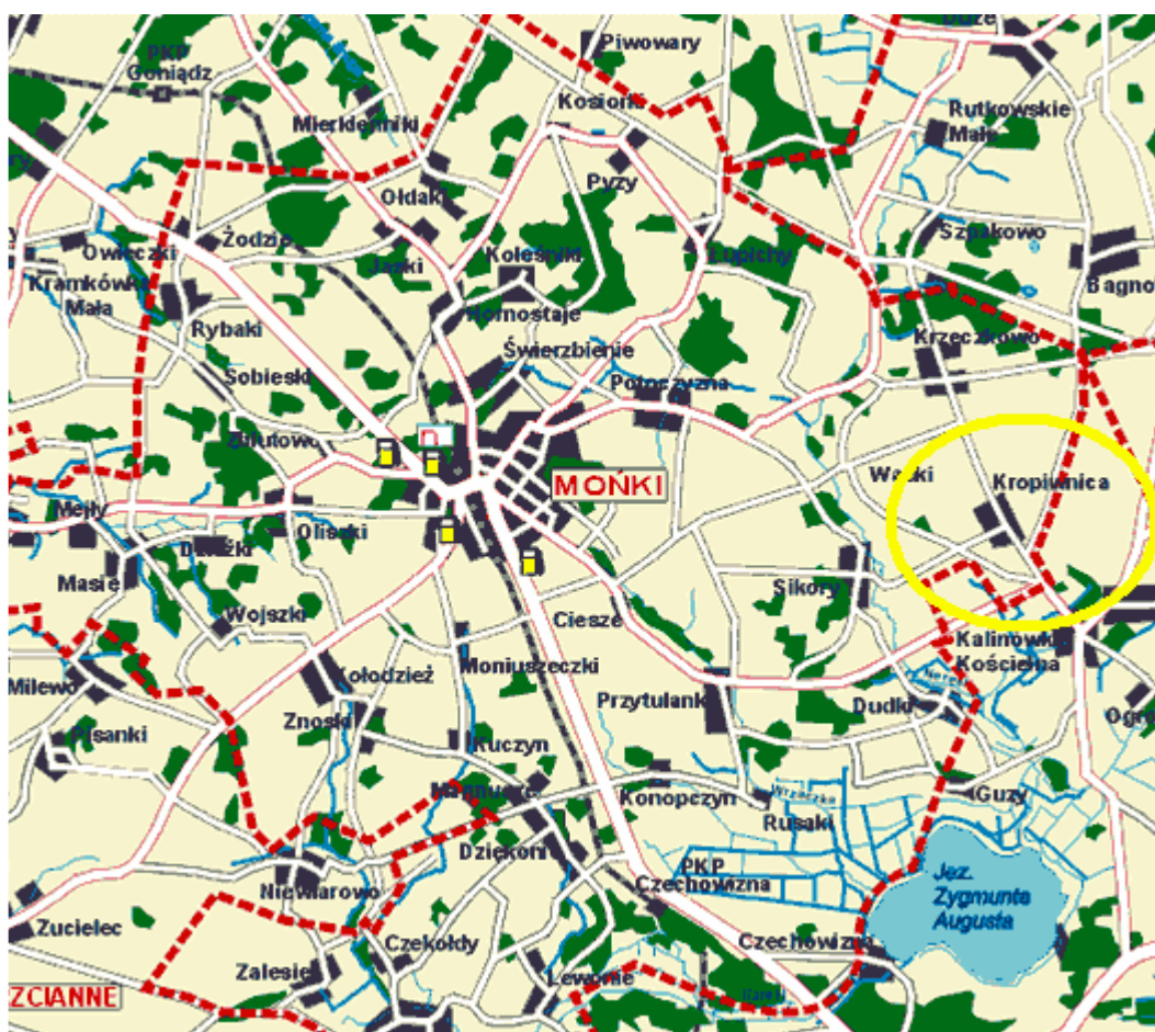
Mapa Nr 1. Położenie miejscowości Kropiwnica na terenie Gminy Mońki

Powiat moniecki stanowi obszar o wyjątkowych walorach ekologicznych i krajobrazowych. Ze wszystkich stron otaczają go cenne obiekty przyrodnicze: od zachodu pokaźne połacie powiatu obejmuje Biebrzański Park Narodowy, ze strony wschodniej, w granicach powiatu leżą obrzeża Parku Krajobrazowego Puszczy Knyszyńskiej, krańce południowe stanowią natomiast fragment Obszaru Chronionego Krajobrazu „Doliny Narwi” i stykają się z otuliną Narwiańskiego Parku Narodowego.